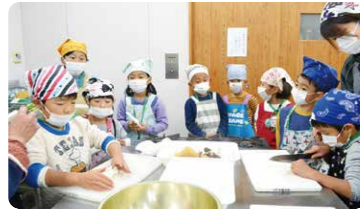
「だご汁」作りを体験する児童

が作った手料理を保護者の方々も一緒に味わいました。体験の最後には、職員がサンタクロースに扮して登場。少し早いクリスマスプレゼントをみんな笑顔で受け取り、参加した塾生は「餅つきが楽しかった」「野菜を切るのが楽しかった」などと感想を話していました。 今回は、来年2月に修了式と交通安全教室、安心・安全な食に関する講話を行う予定です。