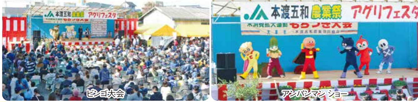
餅投げ大会 アンパンマンショー