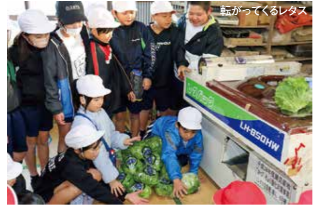
転がってくるレタス