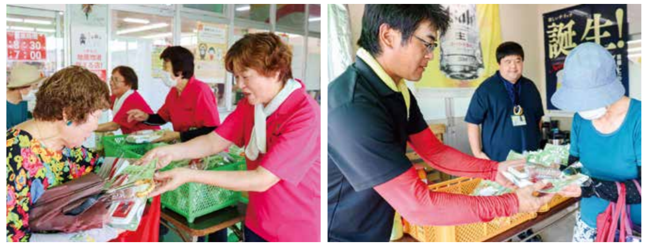
新米を配布する部員

青壮年部・女性部は8月23日、合同で新米キャンペーンを行いました。青壮年部員と女性部員、職員ら9名が、グリーントップ本渡の店頭で天草産コシヒカリ2合(200袋)とエコバッグ、米粉石けん、空き缶・ビン投げ捨て防止のチラシを来店者へ配布。米の消費拡大と地産の新米をアピールしました。 部員の皆さんが「天草でとれた新米です」と手渡すと、受け取った女性は「天草産の新米が貰えて、とても嬉しい。家で食べるのが楽しみです」と笑顔で話されました。 天草は県下でもいち早く新米を収穫できることから、天草郡市青壮年部・女性部の合同イベントとして、毎年キャンペーンを行い地域住民に米の消費拡大を呼び掛けています。この日もJA本渡五和、JAあまくさ、JAれいほくの3JAにわかれて同時に新米が配布されました。