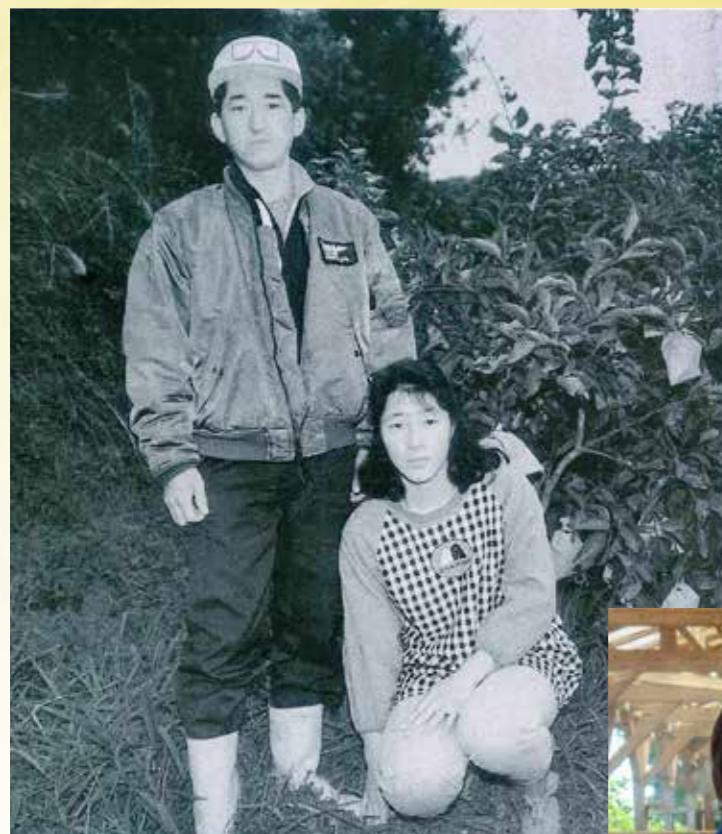
平成4年3月 第14号 表紙 【果樹園の前で撮影】