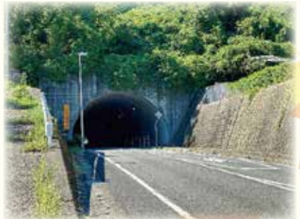
【山口の井龍トンネル】

時間 受付 8:20~8:50【開会式9:00】 スタート 4.3 km : 9:30~ ※完歩後にお楽しみ抽選会を行います。 ※軽食を準備しております。