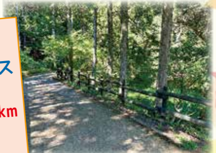
【西の久保公園 遊歩道】