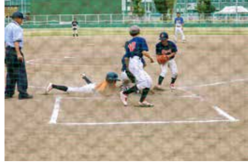
全力ヘッドスライディングでホームイン