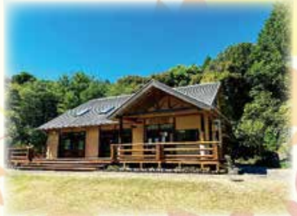
【西の久保公園管理棟 やまびこ館】

申込期間 令和6年11月1日[金]~11月22日[金] ※申込みが定員150名になり次第、受付を終了いたします。