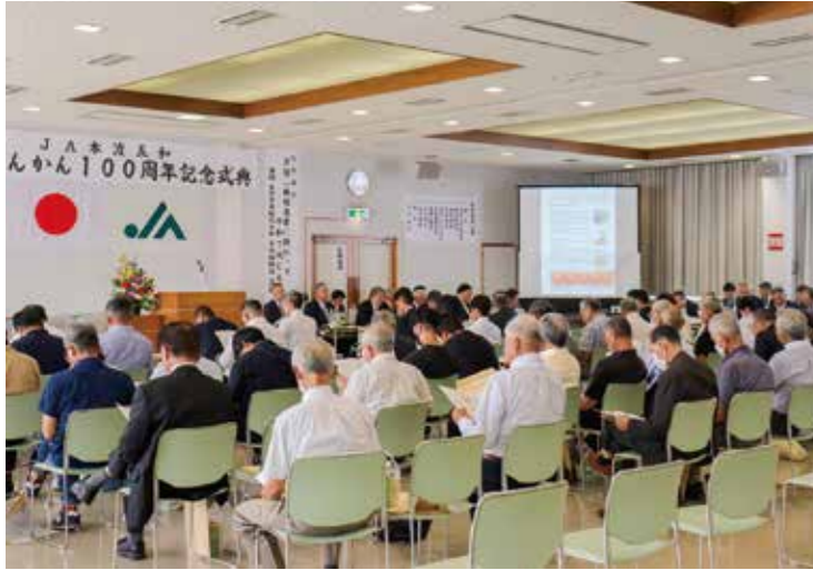
天草ぽんかんの歩み