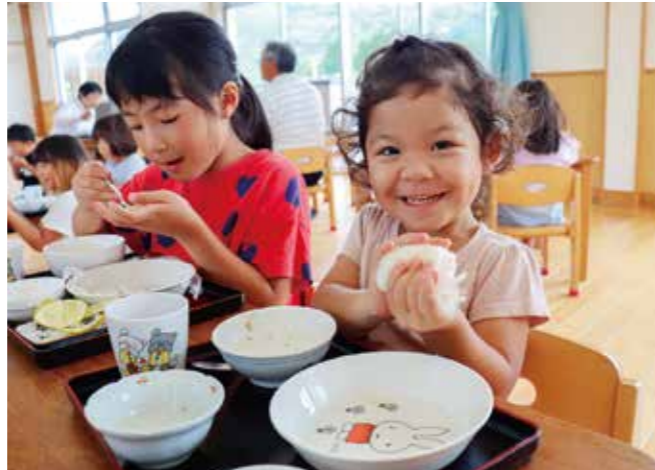
上手におにぎりできました