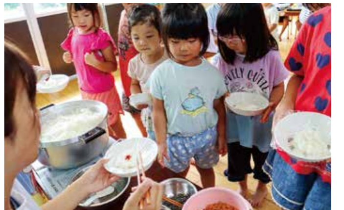
どの具にしようかな

本渡五和管内にある本町保育園は10月17日、稲刈り体験で収穫した新米を使った「おにぎり作り」を行いました。保育園では毎年、本町営農組合の協力で稲刈りを行ったあと、園児が自分たちで具材を選び、収穫した新米でおにぎりを握る体験を行っています。