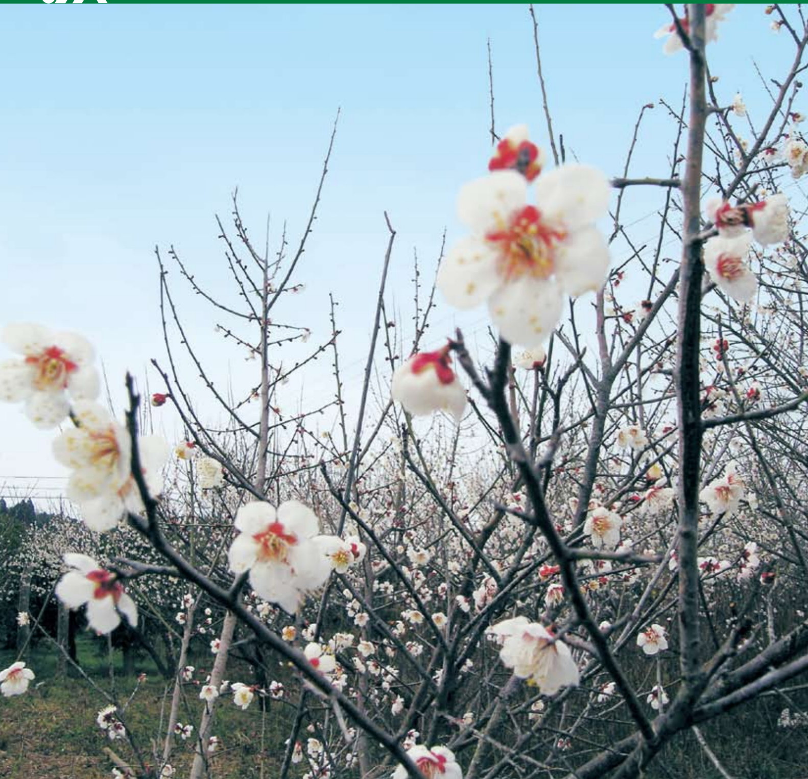
レンズがとらえた ふるさと春夏秋冬