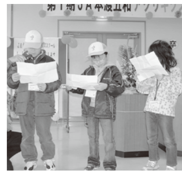
感想文を読む生徒達