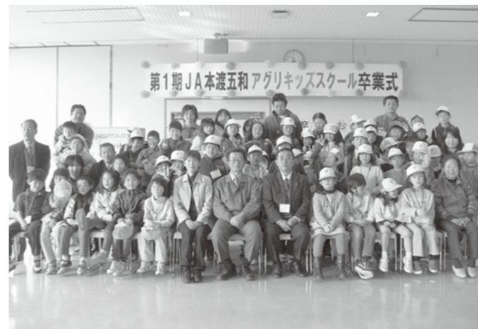
参加者のみんなで記念撮影

参加した生徒の感想文では、「農業はとても大変な仕事だけど大事な仕事だと思った」「友達ができるか不安だったけど、最後はたくさんの友達ができました」「またアグリキッズスクールに入りたいたい」など七人が発表。卒業式終了後は、クラスごとに別れ、カルタ取り・豆まきなど昔の遊びを行いました。本年度より食農教育として取り組んだアグリキッズスクール。営